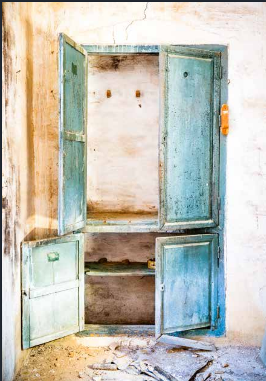
#LO - La alacena Impresión Giclée s/papel Hahnemüle 100 x 143 cm - 2015 Serie "Lugares Olvidados" Ref. JFN-FOT-2015-0078