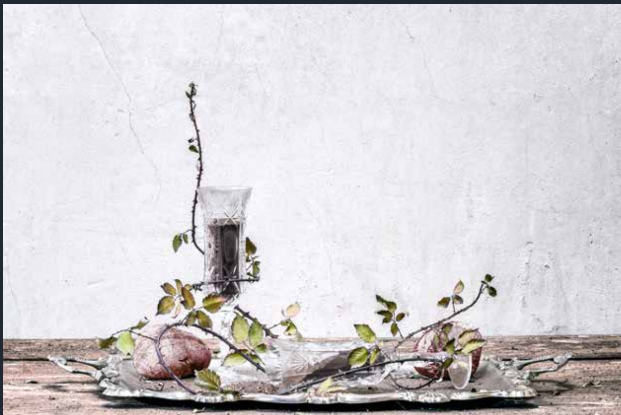
Dos corazones Impresión Giclée s/papel Hahnemühle 120 x 160 cm - 2018 Serie "Bodegones" Ref. JFN-FOT-2018-0009