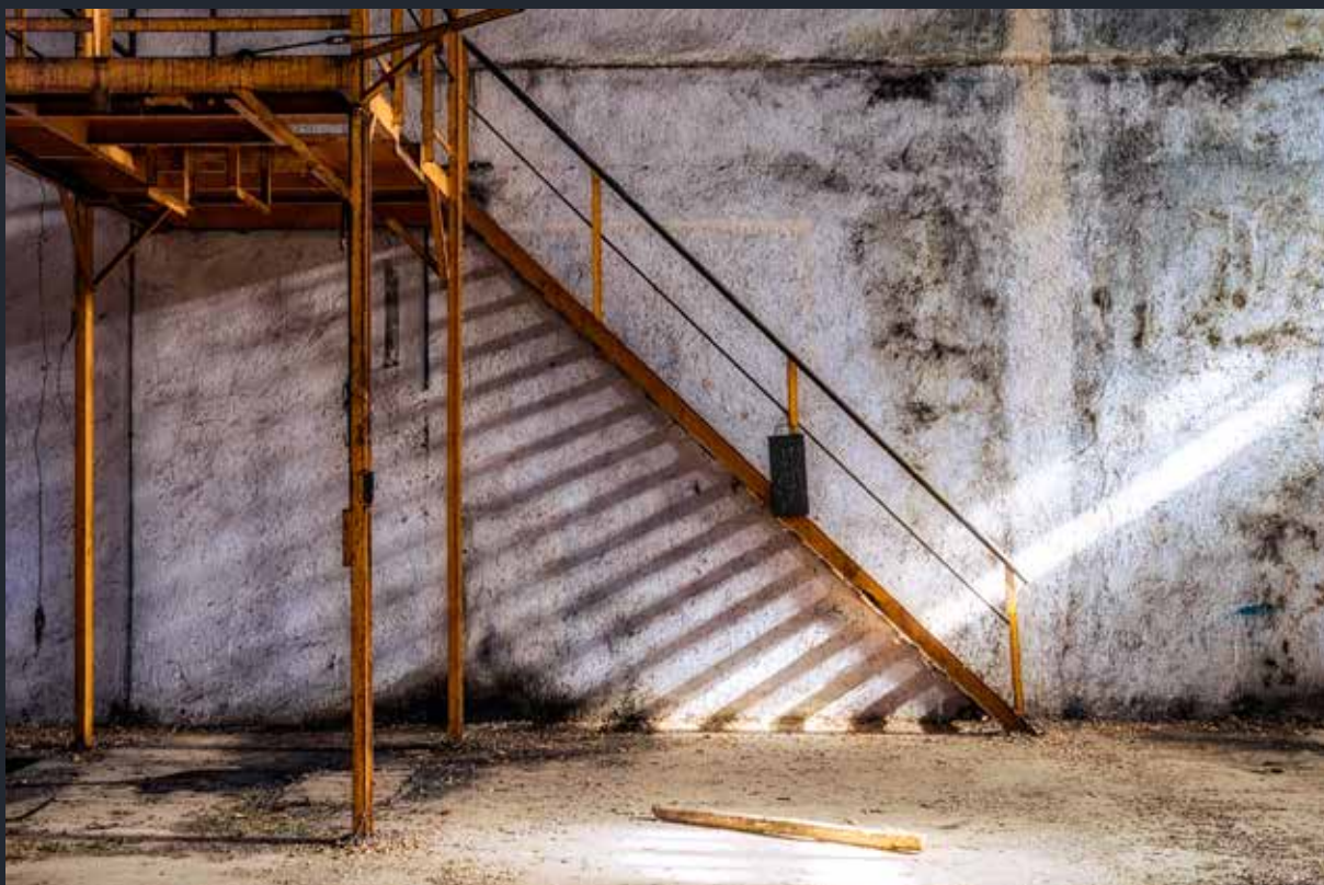
#LO - Luz volumétrica Impresión Giclée s/papel Hahnemüle 100 x 150 cm - 2015 Serie "Lugares Olvidados" Ref. JFN-FOT-2015-0081