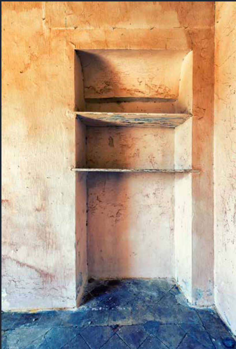
#LO - La alacena II Impresión Giclée s/papel Hahnemühle 148 x 100 cm - 2016 Serie "Lugares Olvidados" Ref. JFN-FOT-2016-0144