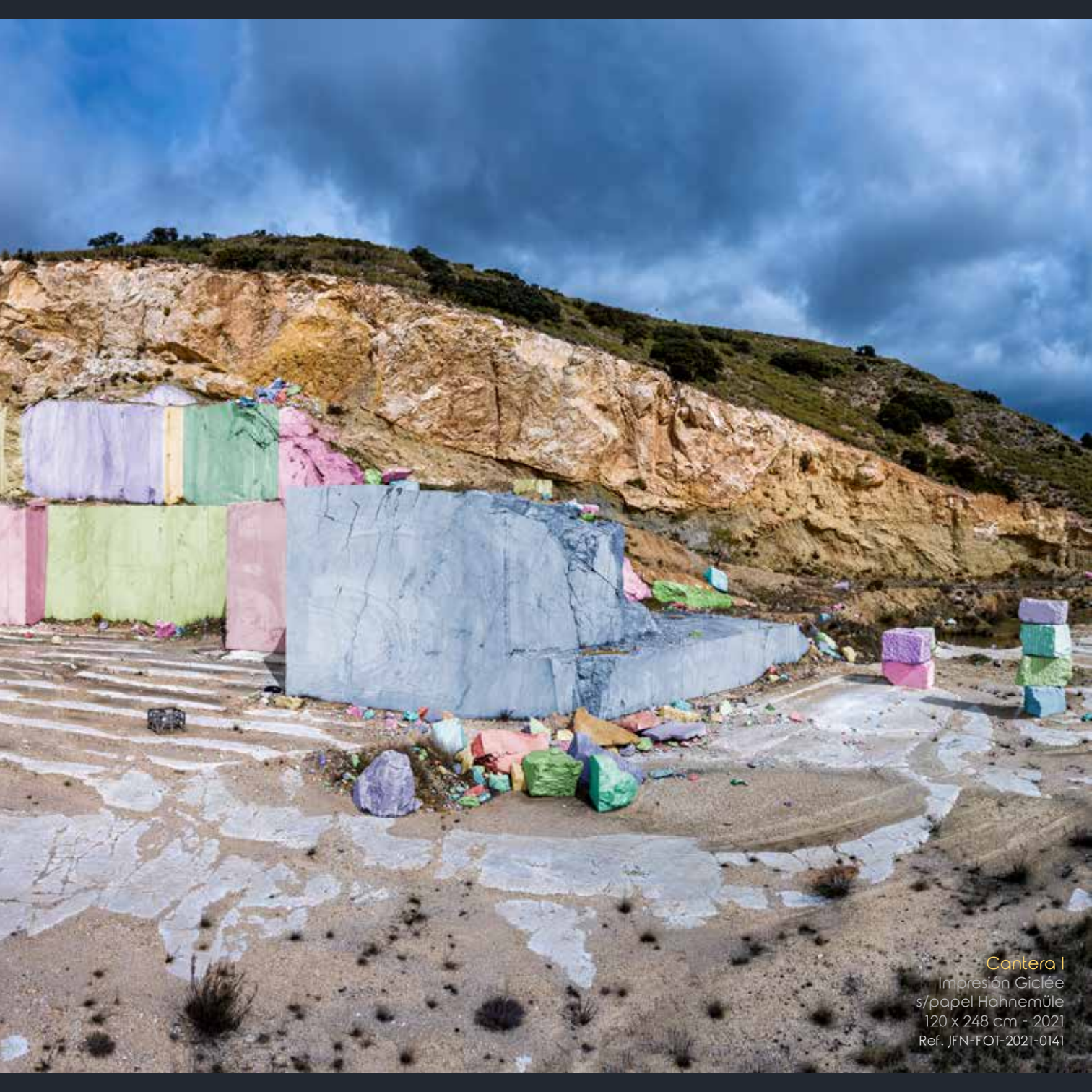
Cantera I Impresión Giclée s/papel Hahnemüle 120 x 248 cm - 2021 Ref. JFN-FOT-2021-0141