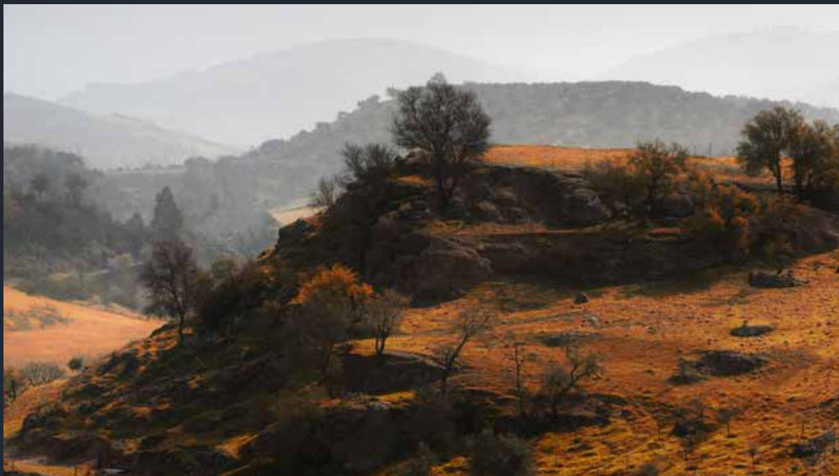
Paisaje imaginado Impresión Giclée s/papel Hahnemühle 140 x 249 cm - 2016 Ref. JFN-FOT-2016-0110